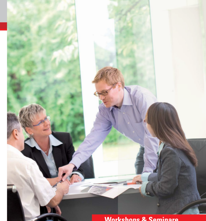
Workshops & Seminare